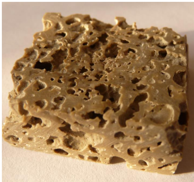
Рис. 1. Образец крупнопористого глинополимерного композита

Для опытов методом термополимеризации были получены образцы крупнопористых глинополимерных композитов (рис. 1), которые в сухом виде содержали бентонита 66,2 %, полиакрилата натрия 26,3%, остальные 7,5 % составляли N,N' – метиленбисакриламид, персульфат аммония, карбонат натрия, акриловая кислота.