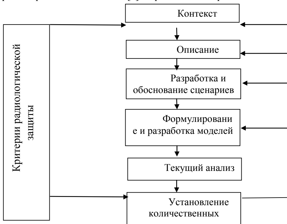
Рис. 1. Подход по установлению пределов активности в период эксплуатации и после закрытия хранилища

В данной статье на основе доступных литературных публикаций рассмотрены основные существующие в настоящее время неопределенности в описании системы захоронения РАО на площадке «Вектор». Эти неопределенности приводят к усложнению и к недостоверности расчетов в отношении пределов активности, которая может быть безопасно размещена на площадке с учетом долговременного существования хранилища – 500 и более лет. Общий подход к установлению пределов активности в период эксплуатации и после закрытия хранилища изложен в [3] и представлен на рис. 1.