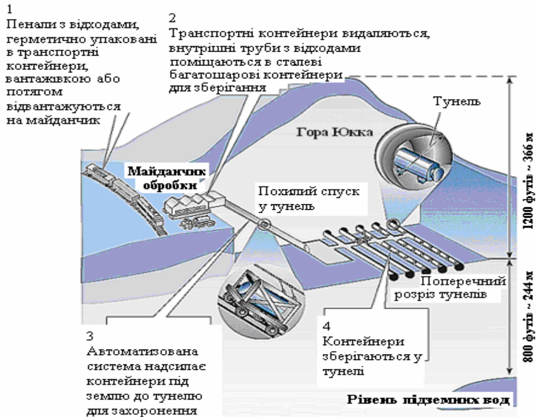
Рис. 3. Схема геологічного сховища Юкка Маунтін, США

Воду необхідно не допускати до контейнерів через те, що температура на поверхні контейнерів буде перевищувати 100 °С протягом перших 1000 років. Інші інженерні бар'єри системи захоронення спрямовані на створення зон з ненасиченими умовами шляхом відведення потоку підземних вод від відходів, або на контролюванні хімічного складу води в безпосередній близькості до відходів.