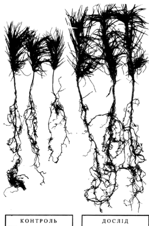
Рис. 1. Дослідні зразки однорічних сіянців сосни звичайної з лісорозсадника УНДІ лісового господарства і агломерації (с.м.т.Лютіж), 2005 рік

Перші захисно-декоративні лісостани у Київській області, створені за розробленою технологією, досягли 10-річного віку і, як показали дослідження, відзначаються біологічною стійкістю, високою екологічною ефективністю і продуктивністю (рис.1 та рис.2).