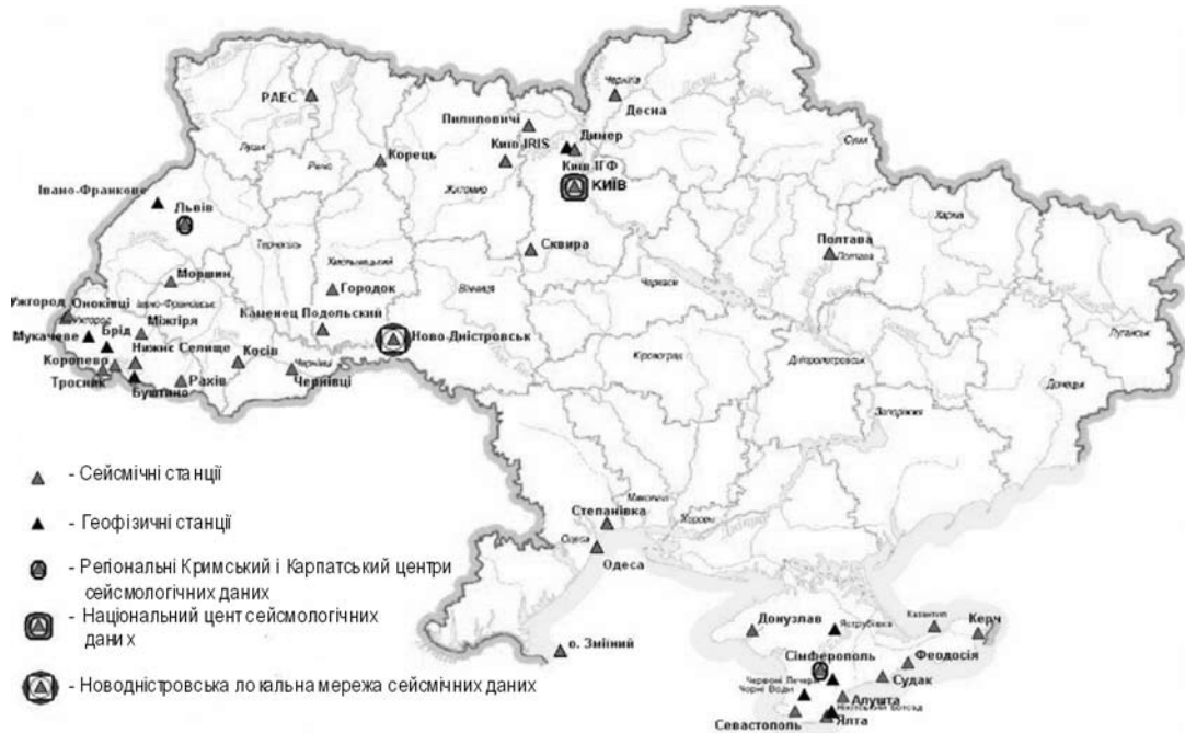
Рис. 3. Мережа сейсмічних і геофізичних станцій НАН України станом на січень 2009 р

Важливою ланкою системи сейсмологічного моніторингу є створений в ІГФ НАН України Національний центр сейсмологічних даних (НЦСД). НЦСД здійснює збір і накопичення сейсмологічної інформації, виконує оперативну оцінку сейсмологічної обстановки у всіх регіонах України, дозволяє забезпечити сейсмологічними даними геофізичні дослідження внутрішньої будови Землі та роботи з сейсмічного захисту.