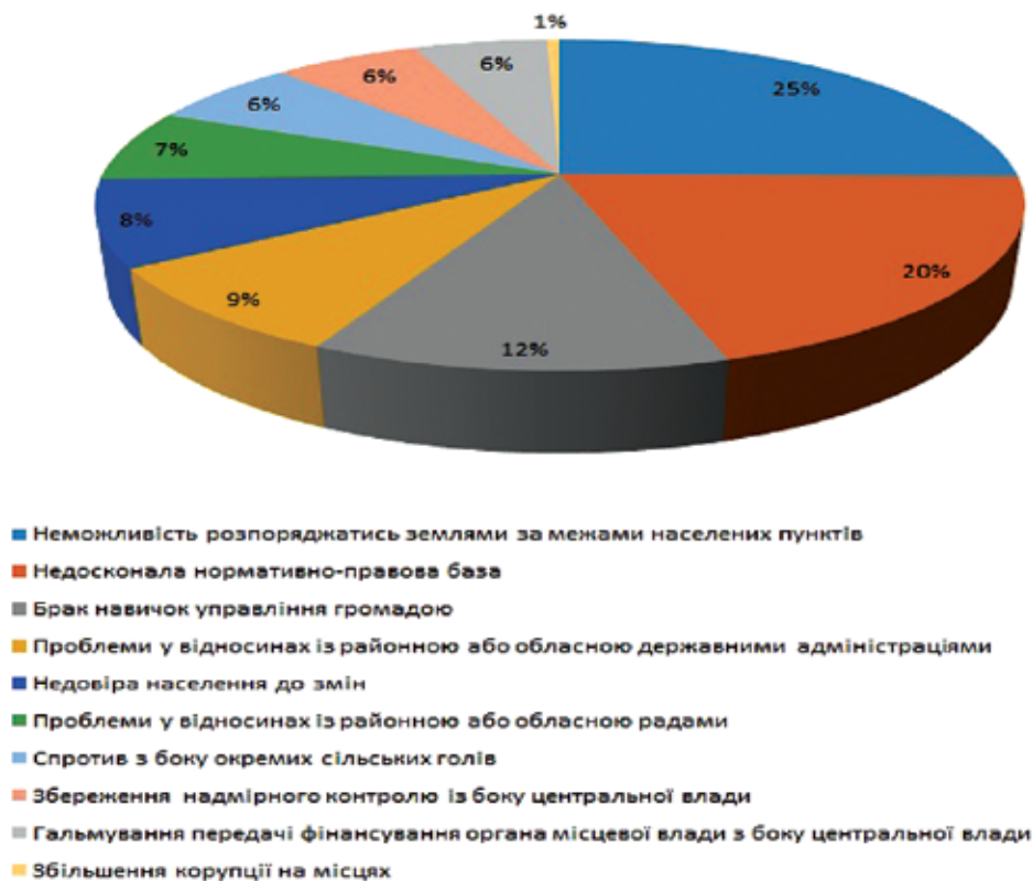
Рис. 1. Негативні результати об'єднання громад (за результатами опитування [17])

Для ефективного врегулювання поточної екологічної ситуації, а також запровадження пом'якшуючих заходів щодо можливого негативного впливу на довкілля необхідно враховувати, що, незважаючи на проведену роботу стосовно реформи децентралізації, на даний час в Україні залишається актуальним ряд