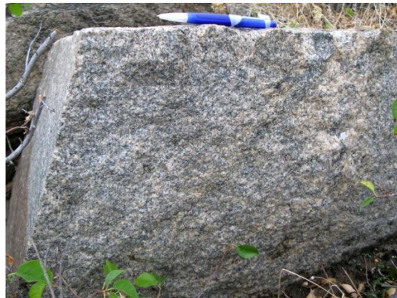
Рис. 1. б Теж саме у вертикальному субмеридіональному зрізі – площині сланцюватості. Видно субвертикальну лінійність за біотитом. Експозиція західна.

За даними [5, 7 та ін.], Мокромосковський масив сформовано декількома різновидами гранітів: найбільш розповсюджені темно-сірі дрібнозернисті, менше – біотит- та мусковітвмісні пегматоїдні. Граніти містять декілька генерацій пороудоутворювальних мінералів та ядер і оболонок доростання в акцесорних мінералах. Температура утворення провідних різновидів гранітів – 540-670^\circ\text{C} ; вік граніту за цирконом – 2827 \pm 7,2 млн. років, за монацитом — 2700 \pm 8 млн. років [5].