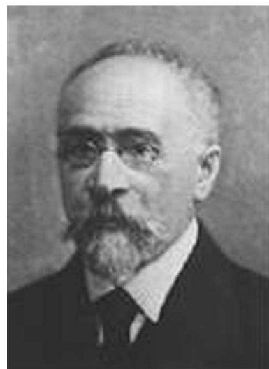
Алексей Петрович Соколов (1854—1928)

Среди характерных энергетических проявлений, зафиксированных в памяти геологических образований, можно назвать: палеомагнитные, структурно-динамические (глобальные, региональные, локальные, микроструктурные), структурно-тектонические особенности, физические поля, многие вещественные, структурно-текстурные признаки, анизотропию, физические характеристики – магнитные, упругие, теплофизические, емкостные и др. В результате комплексного изучения последних автор этих строк в 2007 г. сде-