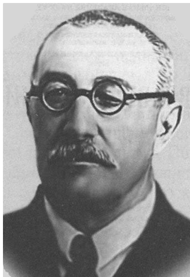
Владимир Иванович Лучицкий (1877—1949)

лал научное открытие: «Явление петрофизической фиксации геодинамических процессов гранитоидными образованиями» [26, 27].