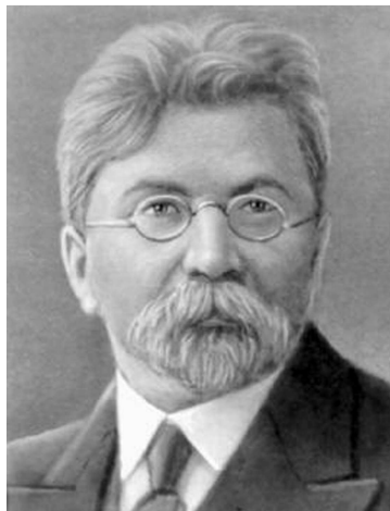
Микола Прокопович Василенко (1866—1935)