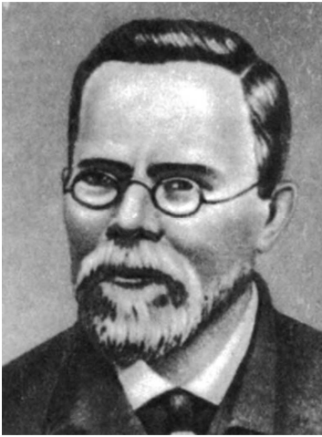
Микола Михайлович Сібірцев (1860—1900)

зею. Його неповторність для свого часу виявилась у поєднанні природних і культурних пам'яток. Тривалий час у музеї зберігалась археологічна карта давніх культур Полтавщини, виготовлена В.І. Вернадським і подарована серед перших експонатів.