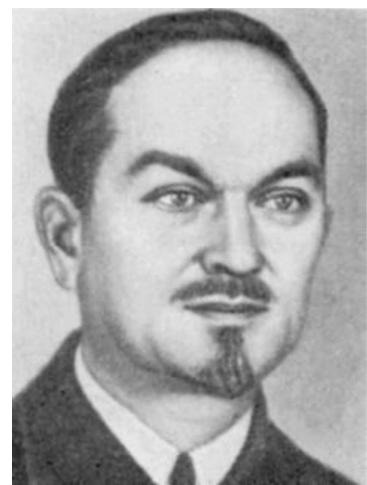
Микола Григорович Холодний (1882—1953)

3) природні ресурси, що накопичені у підземних надрах – руди металів і металоїдів, горючі гази, мінеральні джерела, нафта, кам'яне вугілля, підземні води тощо.