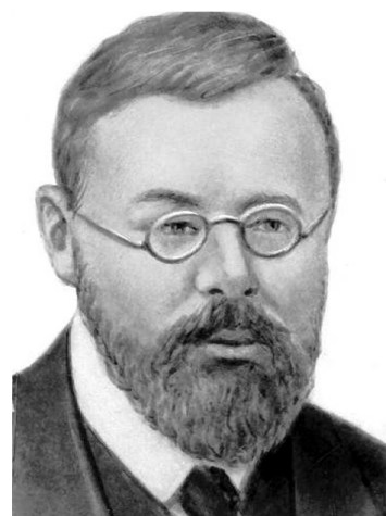
Михайло Іванович Туган-Барановський (1865—1919)

дженням Міністерства доручити обрання Голови Вченого Комітету самому Комітетові, яке обрання мусить бути затвержене мною» [72]. Таке рішення стало доленосним і для нинішньої НААН, коли загальні збори самі обирають собі президента. Далі п. 3 вищезгаданого наказу: «призначити членами Вченого Комітету Міністерства Земельних справ, з 1 січня 1919 р., проф. Павла Тутковського, проф. Юрія Висоцького, проф. Володимира Вернадського». І, як наслідок цього, п. 5: «звільнити з займаних посад з 1 січня: як призначеного Голову Вченого Комітету професора Володимира Вернадського...». Таким чином, стає зрозумілим, що керівники Директорії не вбачали в академікові Вернадському прибічника «української національної справи». Адже Володимир Іванович реально розгорнув українське державотворення на ниві науково-освітнього процесу, зокрема й для потреб сільського господарства, не просто за часів гетьманату, що для Директорії було доволі важливим, а й узагалі в іншій площині цінностей – у так званий проросійський бік. Спроби Директорії УНР провести повну реорганізацію УАН та СГВКУ викликала з боку В.І. Вернадського шалений протест і протистояння.