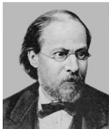
Микола Петрович Вагнер (1829—1907)

Тому не слід забувати в сучасних «пошуках» істини і про раніше накопичений досвід підготовки фахівців. На прикладі В.І. Вернадського це не лише наявність високоосвічених учених-педагогів, а й отримання ще у так званій шкільній підго-