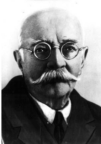
Свген Костянтинівич Тимченко (1866—1948)

Так і сталося стосовно ще однієї сторінки історії України, а саме становлення сільськогосподарської дослідної справи. Відомо, що «ніщо не виникає з нічого і нікуди безслідно не зникає». На підставі досліджень Центру історії аграрної науки Державної наукової сільськогосподарської бібліотеки (ДНСГБ) НААН, а також власних наукових пошуків стверджуємо, що предтечею теперішньої Національної академії аграрних наук України багато в чому є Сільськогосподарський вчений (згодом – науковий) комітет України (СГВКУ) [59, 60]. За своєю організаційною структурою, а також координаційною сутністю СГВКУ відповідав сучасному розумінню поняття академії.