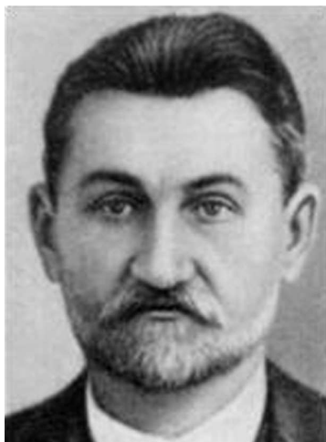
Олександр Григорович Шліхтер (1868—1940)