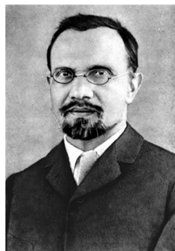
Агатангел Юхимович Кримський (1871—1942)

Бурхливі політичні зміни в Україні протягом 1919 р. змусили В.І. Вернадського шукати застосування своїм талантам не лише як державотворця, а й займатися власними дослідженнями, зокрема з аграрної науки. Місцем їх проведення в цей період стала Дніпровська біологічна станція – перша в Україні прісноводна біологічна станція, заснована у 1909 р. Київським товариством «Любителів природи». Повноцінну діяльність вона розпочала у 1911 р. Територіально станція розміщувалась у Старосільському лісництві на Дніпрі, що на 16 км вище від Києва. Саме там знаходились так звані літні приміщення станції. Основна будівля була у Києві по вулиці Короленка, 55/15 [56]. На цій станції В.І. Вернадський провів більшу частину літа 1919 р., де плідно працював. За свідченням М.Г. Холодного, на той час тут проводили дослідження її ко-