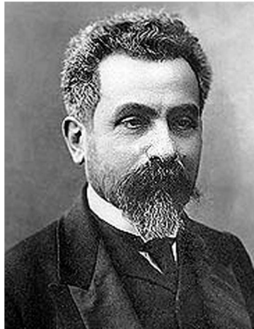
Микола Якович Марр (1864—1934)

За часів Радянського Союзу вперше внесок академіка В.І. Вернадського в розвиток ґрунтознавства було оцінено у 1945 р. в № 7 журналу «Почвоведение». Вихід цього видання заслуговує на повагу, враховуючи, що країна ще перебувала у стані війни. Безперечно, ті опубліковані 48 сторінок швидше слід розглядати як шану вченому за внесок у розвиток вітчизняного ґрунтознавства та світової наукової думки, хоча, звісно, всебічно розглянути проблему було нелегко.