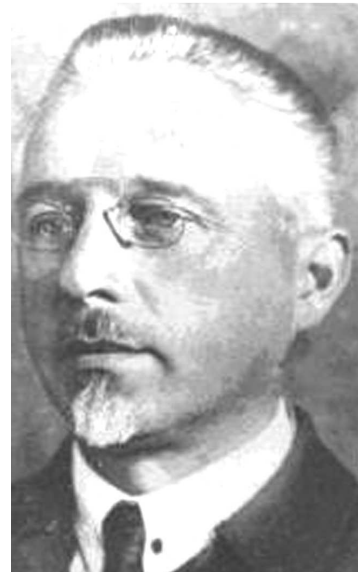
Дмитро Остапович Белінг (1882—1949)

Із викладеного зрозуміло, що перший прихід радянської влади у 1919 р. сприяв поверненню В.І. Вернадського до СГВКУ. Таким чином, він у межах власної компетенції сприяв розгортанню діяльності Комітету через узгодження бюджетного фінансування, статуту, що доволі часто змінювався з еволюцією демократичності до плановості в Україні, а також всіх положень щодо регламентації роботи відділів, секцій та бюро, популяризаційних заходів.