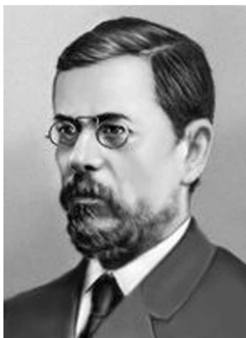
Дмитро Іванович Багалій (1857—1932)

Слід зазначити, що Учений комітет при Міністерстві землеробства був заснований у 1837 р. для розробки питань організації агрономічної служби й галузевої освіти, створення дослідних станцій тощо. У 1916 р. Комітет зазнав значних еволюційних змін, що сконцентрувало в ньому всі галузі й напрями сільського господарства. Восени 1916 р. тогочасний міністр землеробства граф О.О. Бобринський подав проект до Державної Думи про трансформацію СГВК в Інститут дослідної агрономії. 28 червня 1917 р. Тимчасовий уряд прийняв Тимчасове положення про СГВК, згідно з яким його розвиток передбачався як багатопрофільного дослідного інституту з лабораторіями й допоміжними закладами. Такий підхід відповідав концептуальній ідеї В.І. Вернадського щодо створення мережі державних дослідних інституцій, яку він вперше оприлюднив на загальних зборах Комісії з вивчення природничих сил Росії у грудні 1916 р. «Про державну мережу дослідних інститутів у Росії».