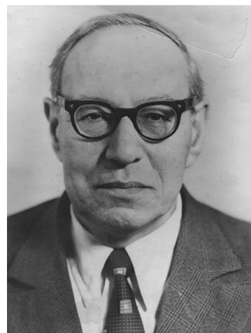
Кирило Павлович Флоренський (1915—1982)

У заголовній статті А.А. Ярилова «Пам'яті найстарішого докучаєвця – академіка Володимира Івановича Вернадського» знаходимо окремі й доволі цікаві факти щодо діяльності вченого на ниві становлення українського ґрунтознавства. Лекції В.В. Докучаєва з мінералогії й кристалографії, які Володимир Іванович відвідував протягом навчання у Петербурзькому університеті, вирізнялися філософським осмисленням проблем природознавства, динамічним підходом до природи й інтересом до генезису мінералів. В.І. Вернадський став активним діячем наукової школи цього прекрасного російського вченого – засновника наукового ґрунтознавства. Фактично перші свої наукові праці він підготував на польовому експериментальному матеріалі, отриманому під керівництвом В.В. Докучаєва, саме на українській землі і, що відродно, саме на Полтавщині – в