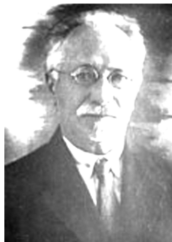
Володимир Григорович Ротмістров (1866—1941)

Не менш визначною є роль В.І. Вернадського у становленні наукового (морфолого-генетичного) ґрунтознавства в Україні. Створена ним особисто карта ґрунтів Кременчуцького повіту Полтавської губернії у 1891 р.