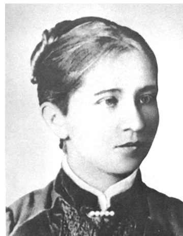
Наталія Єгорівна Старицька (1860—1943)

товці знань іноземних мов. Адже саме вони дали змогу випускникові вузу в юнацькому віці відвідати провідні науково-освітні центри Європи: Берлін, Мюнхен, Лондон, Париж Рим. Поїздки не лише закріпили отримані знання, а й допомогли молодому Володимирові ознайомитися з новітніми досягненнями в основних галузях природознавства і найголовніше – знайти особистий напрям наукових інтересів. З цього приводу нас цікавить сам процес трансформації особистості геніального вченого. Він має певний історичний аспект стосовно становлення українського наукового ґрунтознавства. Відомо, що формування В.І. Вернадського як ученого великою мірою відбулося завдяки В.В. Докучаєву. В.І. Вернадський не лише слухав його лекції, а й брав безпосередню участь в експедиціях на Полтавщині у 1882 і 1884 рр. За матеріалами експедиції Володимир Іванович написав свою першу ґрунтознавчу наукову працю, в якій вперше у світовій літературі зробив спробу кількісно оцінити вплив життєдіяльності байбака – Arietomys Vobak – на ґрунтові процеси. Як згадував В.І. Вернадський, цю працю В.В. Докучаєв опублікував без його згоди. Для самого Володимира Івановича ця невеличка наукова ґрунтознавча праця стала тією відправною основою, яка дала змогу через десятиліття розвинути його уявлення про місце ґрунту, а також живої речовини у біосфері.