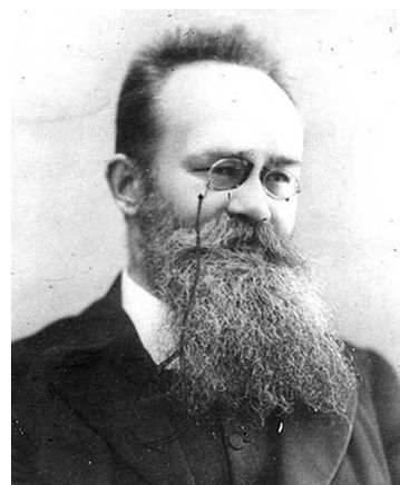
Михайло Сергійович Грушевський (1866—1924)

У 1924 р. В.І. Вернадський знову повернувся до проблем ґрунтознавства через спеціальну доповідь на IV міжнародній європейській конференції у Римі «Про ґрунтовий аналіз з точки зору геохімії». У ній він наголошував, що досконалу картину стосовно ґрунтового покриву земної кори складно отримати на підставі хімічних аналізів, які неможливо між собою порівнювати. Адже ґрунтознавець під час аналізу ґрунту вивчає не більш як 13—15 хімічних елементів, а їх – понад 26. Цю доповідь було надруковано в «Actes de la IV Conferece Internationale de Pedologie, Rome, 12—19, Mai, 1924» (Rome, 1926. – Vol. II. – P. 570); вона викликала величезний науковий інтерес у фахівців усього світу.