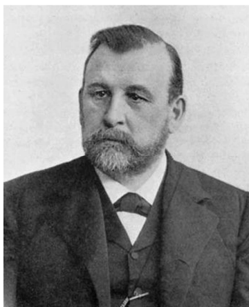
Микола Олександрович Меншуткін (1842—1907)

льність державних інституцій, які організаційно керували науковим процесом забезпечення аграрного сектору країни.