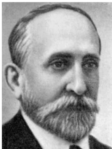
Сергій Федорович Ольденбург (1863—1934)

Крім того, у період з березня до жовтня 1917 р. В.І. Вернадський працював головою Комісії по вчених закладах і наукових установах, був членом Комісії з реформи вищих навчальних закладів при Міністерстві народної освіти, а з 1 серпня 1917 р. його призначили заступником міністра народної освіти Тимчасового уряду Сергія Ольденбурга. Саме з ним, а також зі своїм давнім товаришем академіком М.Я. Марром Вернадський обговорював питання організації Академій наук у Грузії, в Україні, Сибіру [50].