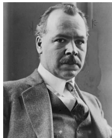
Микола Іванович Вавилов (1887—1943)

Вони писали: «займаючись наразі питаннями своєї внутрішньої організації, Вчений комітет при Комісаріаті землеробства України вбачає доцільним та корисним використання досвіду з питань організації подібних вчених установ Росії, та, передусім, досвіду тотожного йому за завданнями Сільськогосподарського вченого комітету в Петербурзі; ... прийнявши, що ще у зовсім недалекому минулому вирішення наукових питань вивчення кліматичних та ґрунтових особливостей України становило пряме завдання згаданого Комітету» [70]. Стає зрозумілим, чому саме В.І. Вернадському, враховуючи досвід очолювання ним такого типу Комітету до 1917 р. в країні, запропонували керування аналогічним в Україні. За свідченням О.А. Янати: «...Радою Міністрів було затверджено «положення» і штати Вченого Комітету...» [71]. Звісно, все відбувалося за участю Володимира Івановича. Однак 14.12.1918 р. владу гетьмана було ліквідовано, настали часи Директорії (В.К. Винниченко, С.В. Петлюра, Ф.П. Швець, О.М. Андріївський, А.Г. Макаренко), яка 18 грудня 1918 р. тріумфально увійшла до Києва. 26 грудня було створено уряд на чолі з В.М. Чехівським. Трохи згодом, 30 грудня 1918 р., офіційно призначений народний міністр земельних справ у наказі ч. 29 фактично оцінив двомісячну роботу СГВКУ: «...діяльність Вченого Комітету так і не розпочалася...», і далі п. 2 вводить: «замість призначення голови Комітету розпоря-