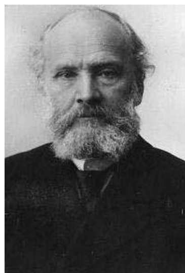
Андрій Сергійович Фамінцин (1835—1918)

Надзвичайно велику допомогу дослідникам надають унікальні й безцінні власноручні нотатки у щоденниках геніального вченого, які наприкінці 1980-х і протягом 1990-х років активно публікувались у періодичних виданнях і популярних журналах. Особливо цікава серія опублікованих праць К.М. Ситника, О.М. Апанович та низка інших [19—23]. Свій внесок у вивчення комплексно недосліджених сторінок спадщини академіка В.І. Вернадського стосовно державотворення в Україні, особливо у світлі науково-освітнього забезпечення, передусім сільського господарства, зроблено й автором цієї публікації [24—30].