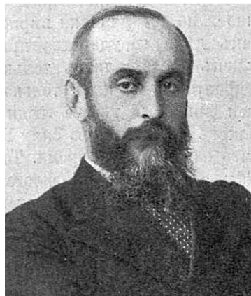
Олексій Олександрович Бобринський (1852—1927)

У 1910 р. в журналі «Почвоведение» надруковано статтю Володимира Івановича «Титан у ґрунтах», в якій він зробив висновок, що «титан при вивітрюванні не виноситься з ґрунту, а, навпаки, збирається й накопичується в ньому» [45].