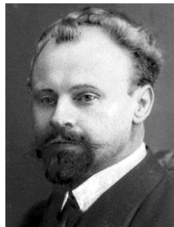
Богдан (Федір) Олександрович Кістяковський (1868—1920)

Після квітневого перевороту 1918 р. в Києві до влади прийшов гетьман П.П. Скоропадський, який добре знав М.П. Василенка і призначив його міністром освіти. Саме М.П. Василенко запросив з Полтави В.І. Вернадського з метою організації Української академії наук. Було утворено відповідну комісію на чолі з В.І. Вернадським, яка й виробила загальну концепцію заснування академії. До її складу увійшли Д.Й. Багалій, М.Т. Кащенко, Б.О. Кистяківський, Й.Й. Косоногов, А.Ю. Кримський, Г.Г. Павлуцький, Є.В. Спекторський, В.О. Сперанський, С.П. Тимошенко, Є.К. Тимченко, М.Й. Туган-Барановський, П.А. Тутковський, С.Л. Франкфурт. Саме останній і представляв інтереси вітчизняної аграрної науки. Хоча заслужений професор сільськогосподарського відділення Київського політехнічного інституту Микола Теофанович