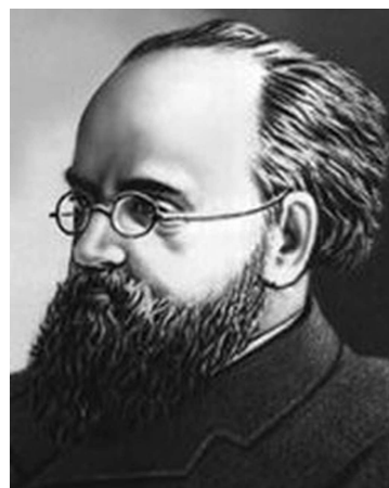
Олександр Іванович Восійков (1842—1916)

Ґрунтознавство є тією галуззю, що перевела сільськогосподарську науку з рангу прикладних у ранг фундаментальних природознавчих [27, 33], тому потрібно детальніше розглянути роль у цьому процесі В.І. Вернадського, бо є підстави вважати, що системні знання про ґрунти, у тім числі й українські, дали змогу Володимирові Івановичу творчо налаштувати дія-