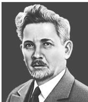
Степан Прокопович Тимошенко (1878—1972)

зроблено спробу в контексті науково-освітнього забезпечення тогочасного сільського господарства виправити ситуацію й повернути українській історії аграрної науки одного з її фундаторів [66]. Що це було саме так, виявилось у процесі підготовки тритомної збірки документів і матеріалів, присвячених святкуванню на державному рівні 75-річчя створення Національної академії аграрних наук України. Видання вийшли в спеціальній серії ДНСГБ НААН «Аграрна наука України в особах, документах, бібліографії» [59, 67, 68].