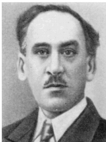
Олександр Васильович Фомін (1869—1935)

є не лише першою картою на генетичній основі окремого територіального району земель сучасної України, а й складовою першої для Росії і, зрозуміло, для України, 10-верстової ґрунтової карти Полтавщини або обласного територіального поділу, теж на генетичній основі. Низка наукових праць, написаних В.І. Вернадським у період перебування в Шишаках на Полтавщині, Дніпровській ботанічній станції, у Криму протягом 1917—1920 рр. сприяли подальшому розвитку ідей його вчителя професора В.В. Докучаєва стосовно морфолого-генетичного ґрунтознавства не лише для України, а й у світовому контексті.