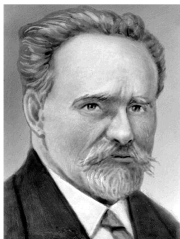
Володимир Андрійович Косинський (1864—1938)

У Центральному державному архіві вищих органів влади і управління (ЦДАВОВ) України зберігається особова справа В.І. Вернадського, яка є унікальною в переліку особового складу співробітників Наркомзему [75]. Із записів видно, що вона заведена кадровиками Народного Комісаріату земельних справ Української РСР 30.01.1919 р. і завершена 04.04.1919 р. У цій «Справі» знаходимо і лист-відповідь на заяву В.І. Вернадського від 30.01.1919 р.