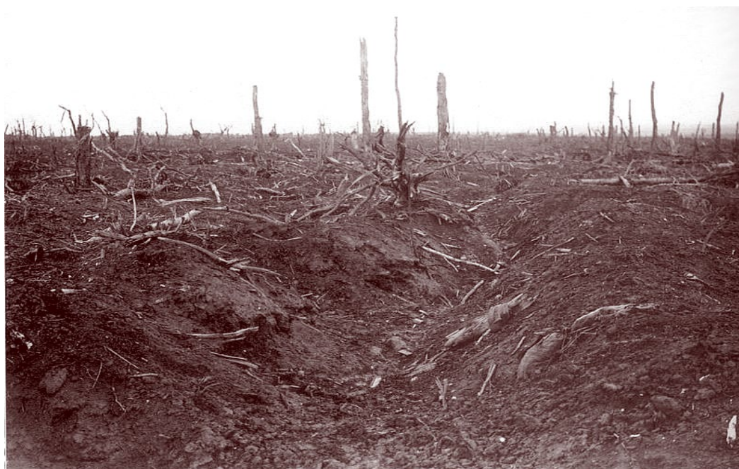
Рис. 1. Військовий «бедленд», що утворився у результаті інтенсивних бойових дій на місці лісового біогеоценозу

1.1. Зміна ландшафту зазвичай – це знищення колишнього природного або антропогенного ландшафту й утворення белігеративних ландшафтів (Денисюк та ін., 2023; Denysyk et al., 2025; Ismayilov et al., 2025) із поствійськовими бедлендами включно внаслідок інтенсивних обстрілів території, руйнування населених пунктів, руху важкої військової техніки та пожеж. Прикладом є знищення частини лісових ландшафтів Серебрянського лісу, Кременських лісів та їх перетворення на військові «бедленди» (рис. 1, 2). Характерні масштабні лісові пожежі. Практично повністю знищено антропогенні селітебні міські ландшафти м. Маріуполь, м. Мар'їнка, м. Авдіївка, м. Бахмут, м. Покровськ та багатьох інших. Залишки населених пунктів характеризуються накопиченням значних обсягів будівельного сміття на поверхні ґрунту, оцінка кількості якого поки відсутня. Однак Міністерством розвитку громад та територій України наведено дані щодо кількості відходів, які утворилися на території Київської, Чернігівської та Сумської областей унаслідок їх