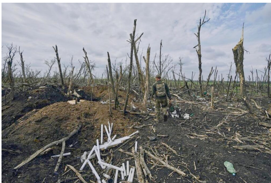
Рис. 2. Знищений дубовий ліс у зоні бойових дій ( https://1news.zp.ua/u-vogni-bojovih-dij-vijna-zminyue-ekologichnij-stan-dovkilliya-zaporizkoi-oblasti/ )

Індикатори: наявність лінійних водно-ерозійних форм – ярів (можливо визначити за космічними знімками), уміст органічної речовини (визначається за ДСТУ 4289:2004), гранулометричний склад верхніх горизонтів ґрунту (визначається за ДСТУ 4730:2007).