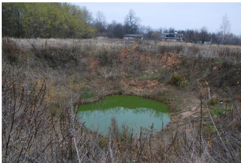
Рис. 6. Вирва від вибуху авіабомби ФАБ-500 (лютий 2022 р.), с. Базар Коростенського р-ну Житомирської області. Фото О.О. Орлова, листопад 2025 р.

Джерелами слугують двигуни військової техніки та вибухи.