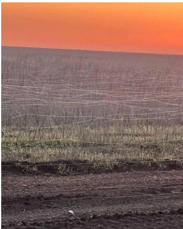
Рис. 8. Оптоволоконно від FPV-дронів на полі у зоні бойових дій

гумусу у його верхніх горизонтах. За даними (KSE, 2024), станом на кінець 2024 р. загальна площа земельних угідь України, пошкоджених війною, становила 186 тис км 2 (31% загальної площі країни). На площі близько 30 тис км 2 втрата природної родючості ґрунту перевищує 75%.