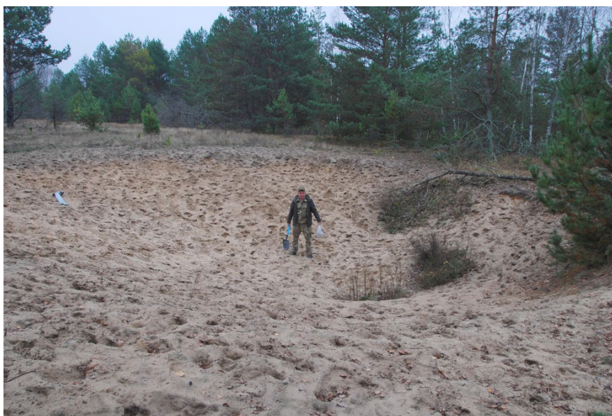
Рис. 7. Вирва від вибуху ракети до системи «Ураган» (лютий 2022 р.), Древянський ПЗ, окол. с. Малі Миньки Коростенського р-ну Житомирської області. Фото О.О. Орлова, листопад 2025 р.

Мережа сховищ радіоактивних відходів (РАВ) Державного спеціалізованого підприємства «Об'єднання «Радон», включаючи Київське (Пирогово) (центральний майданчик), філії у Дніпрі, Львові, Одесі та Харкові, які збирають, транспортують та тимчасово зберігають тверді і рідкі РАВ та відпрацьовані джерела іонізуючого