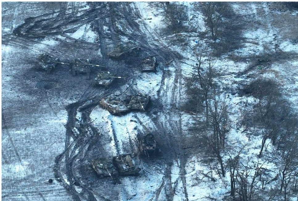
Рис. 5. Танкові сліди і залишки танкової колони рф, знищеної ВСУ під Вугледаром ( https://www.nytimes.com/2023/03/01/world/europe/ukraine-russia-tanks.html )

Інші дослідники (Althoff, Thien, Todd, 2010) для танку Abrams M1A1 навели дані, що після 1–3-кратного проїзду танку об'ємна щільність ґрунту самовідновлювалася за 1–3 роки, а хімічні