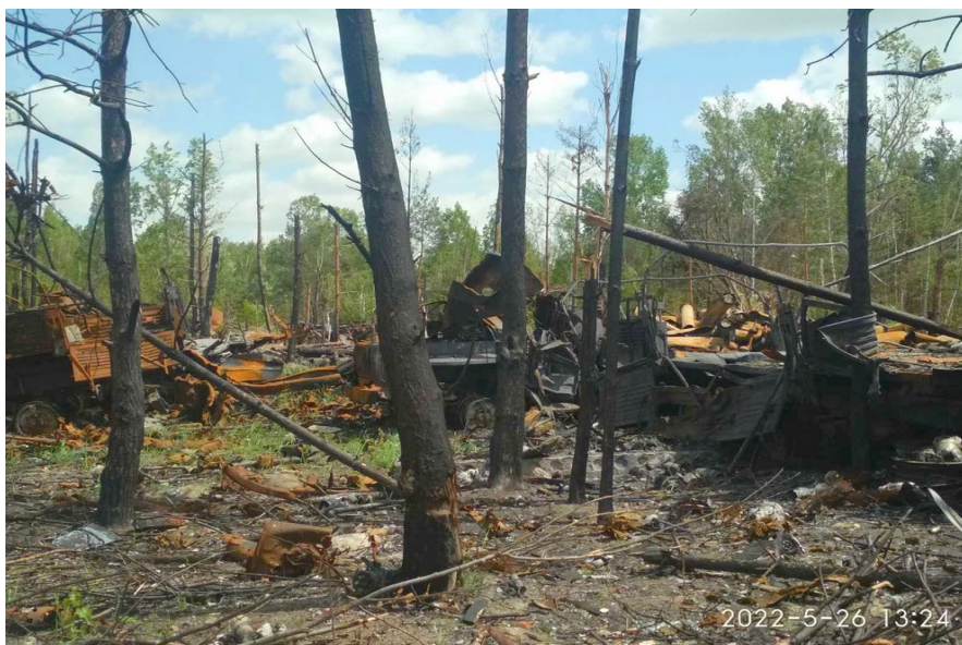
Рис. 4. Лісовий ландшафт, захарашений рештками підбитої військової техніки рф, Поліський р-н Київської обл. Фото О.О. Орлова, травень 2022 р.

Екологічні наслідки. Унеможливує або утруднює обробіток ґрунту та його ремедіацію через наявність механічних перешкод. Засмічення поверхні ґрунту рештками лісової (деревної) рослинності формує три біогеохімічні субцикли поживних речовин, які відрізняються тривалістю: довготерміновий (стовбури дерев) – сотні років; середньотерміновий (гілки дерев) – від кількох десятків до 100 років; короткотерміновий – від 1 до 10 років.